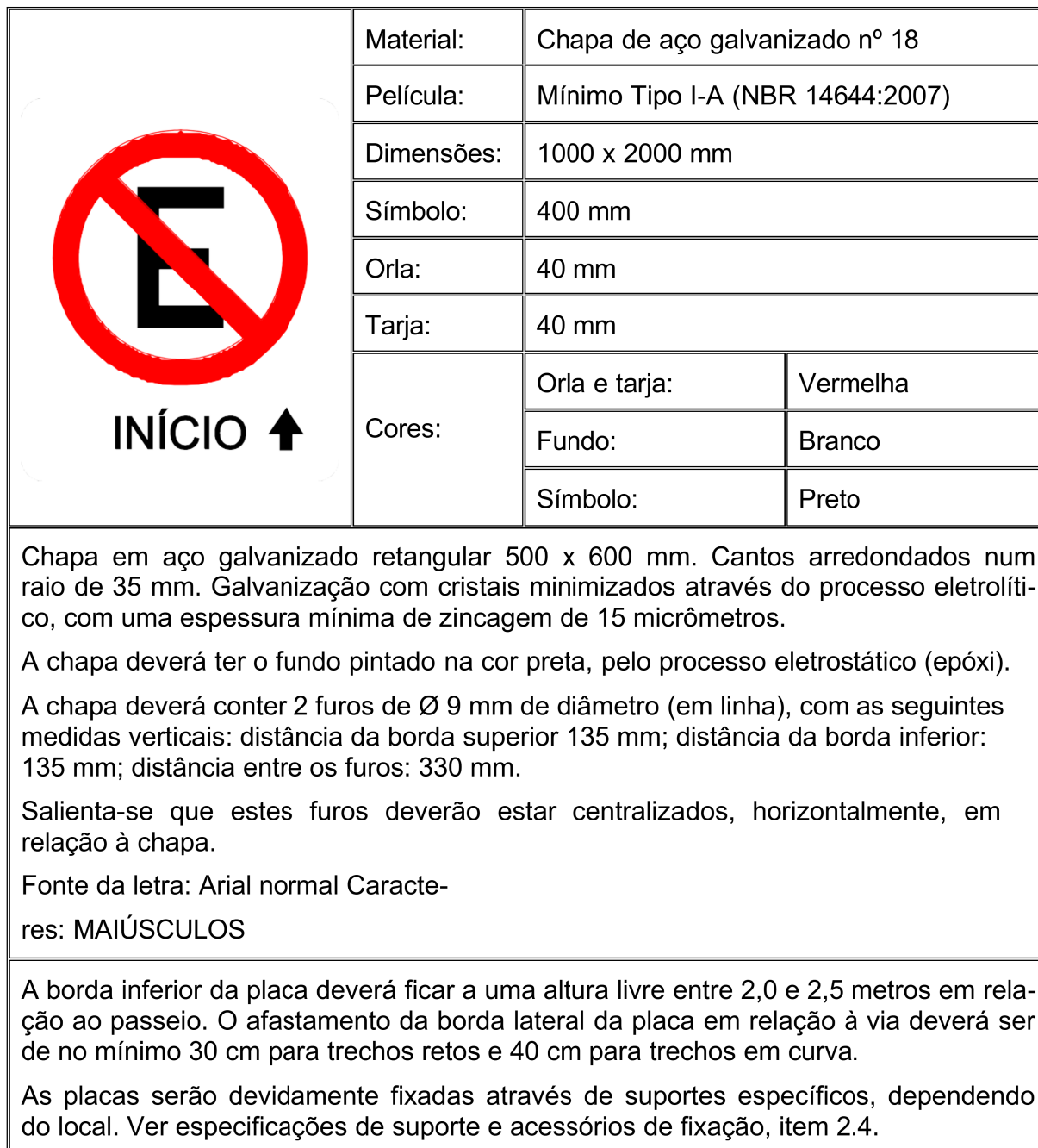
Figura 03 – Exemplo de placa retangular 500 x 600 mm