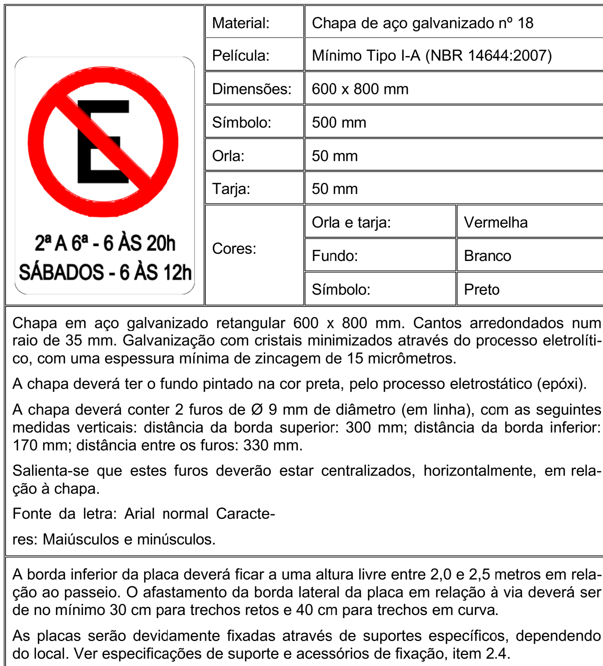
Figura 04 – Exemplo de placa retangular 600 x 800 mm