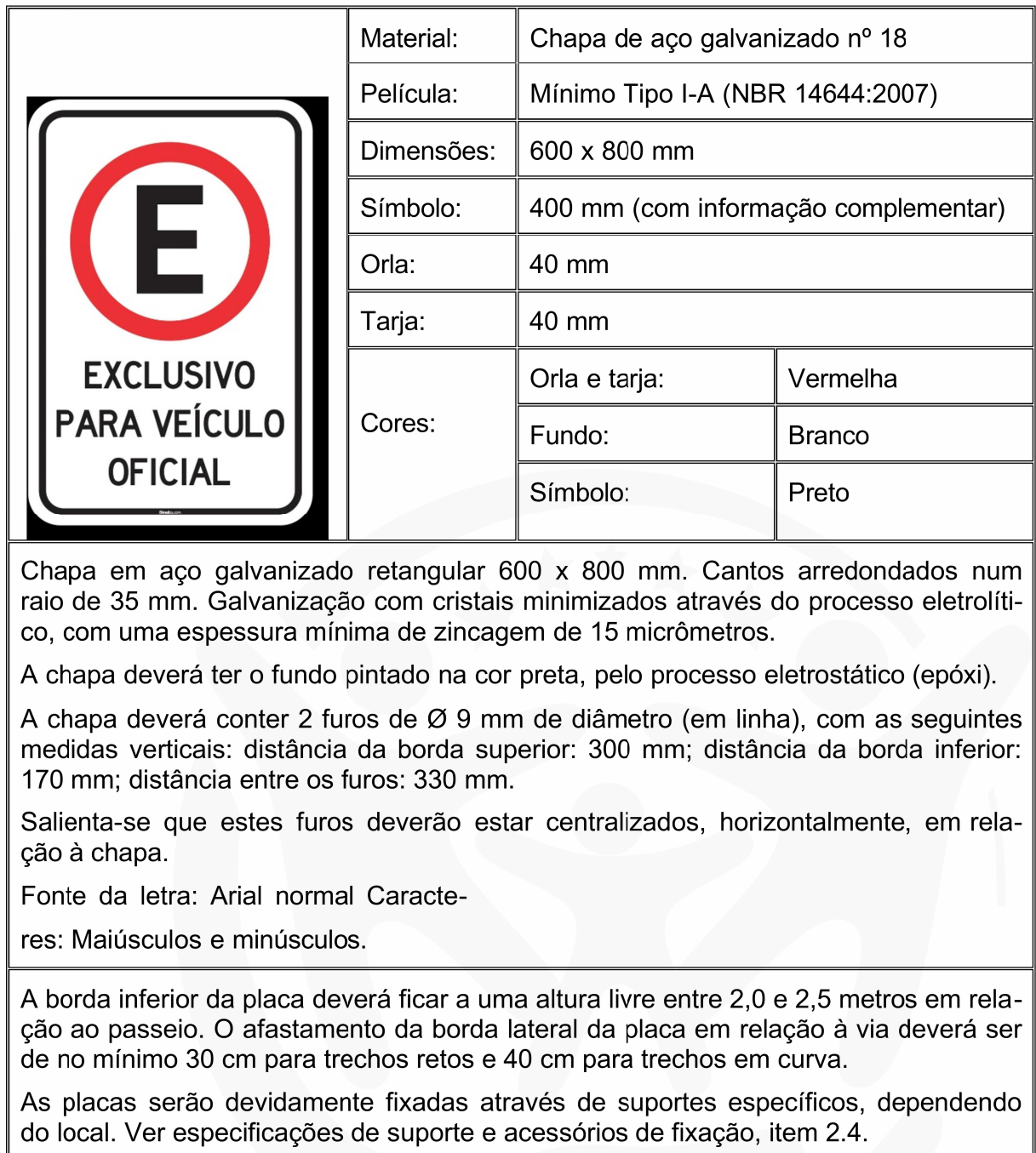
Figura 05 – Exemplo de placa retangular 600 x 800 mm

Placa retangular 600 x 800 mm – com informação complementar: