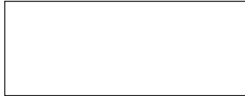
VISTA SUPERIOR/MESA DE TRABALHO