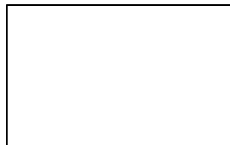
VISTA SUPERIOR/MESA DE TRABALHO