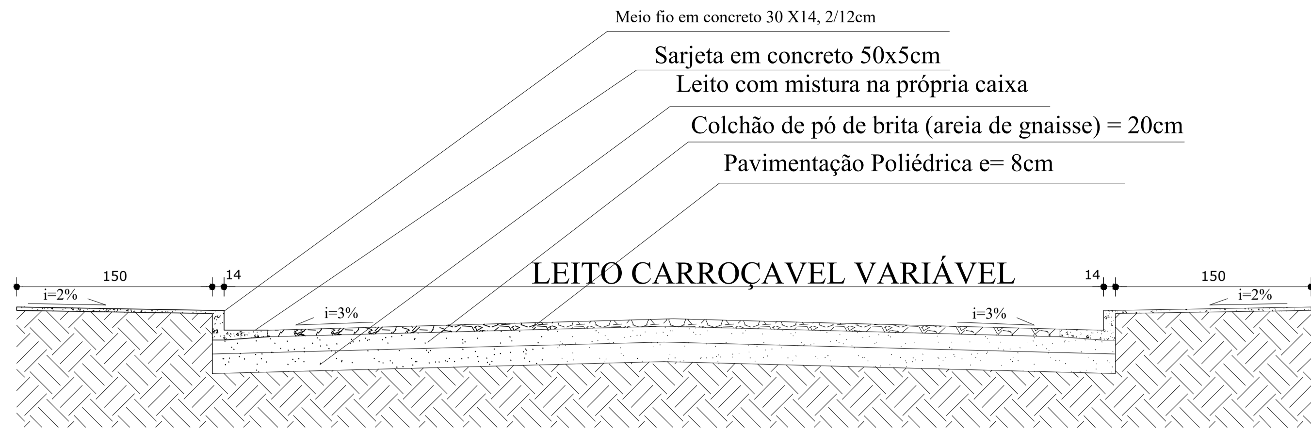
SEÇÃO TIPO (CORTE TRANSVERSAL RUAS) ESC: 1/10