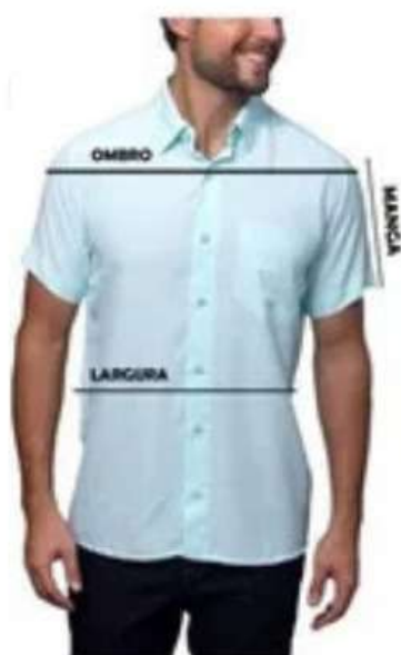
Tabela Medidas Camisas - MC